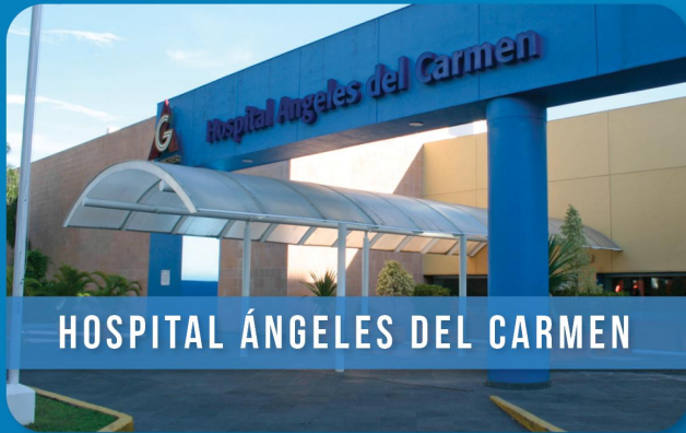
HOSPITAL ÁNGELES DEL CARMEN