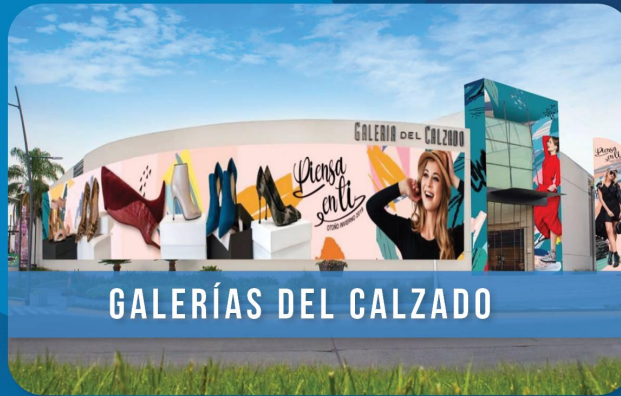
GALERÍAS DEL CALZADO