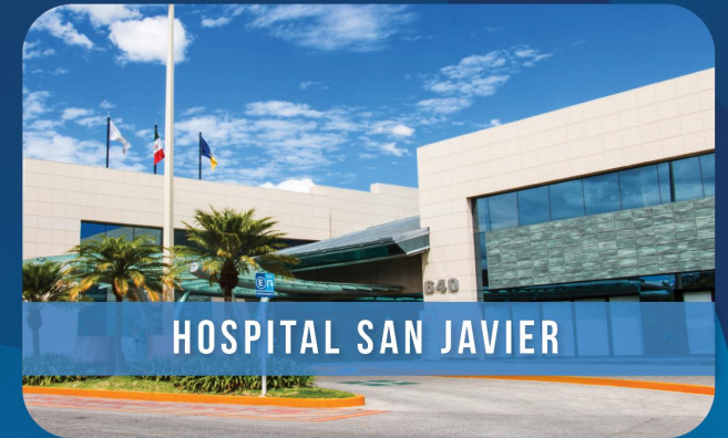
HOSPITAL SAN JAVIER