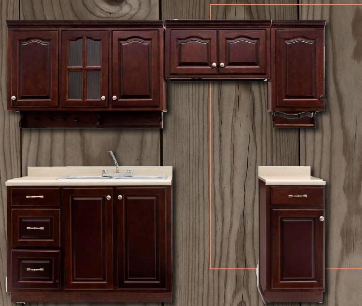
Cocina integral de pino con cubierta de formaica.