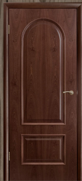
Puerta de madera de pino con acabado color natural.